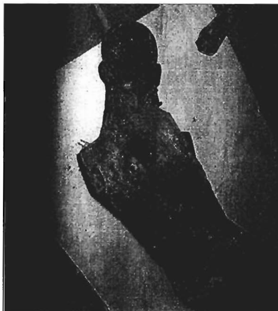
Cristo de Siresa. Detalle de la parte superior del dorso.

como propios de los crucificados realizados durante el segundo tercio del siglo XIII. Es en esta época cuando el arte poco a poco regresa a la observación de la naturaleza, lo que se manifiesta en el tratamiento de la anatomía, que abandona los modelos de tipo bizantino. Las manos se representan abiertas y con los dedos muy largos; los pulgares se acercan a los otros sin llegar a tocarse. El perizonium , después de haber dejado las rodillas descubiertas durante el siglo XII, empieza por cubrir una sola rodilla (al acabar el siglo XIII cubrirá las dos) y su borde inferior sube en línea oblicua, descubriendo la otra rodilla y la mitad del muslo del lado contrario. Los pies guardan rotación externa, se acercan el uno al otro en forma paralela siguiendo la línea de las piernas, que se flexionan ligeramente en las rodillas 12 .