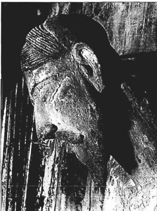
Cristo de la ermita de San Mamés. Asín de Broto (Boltaña). Detalle del lado izquierdo del rostro.