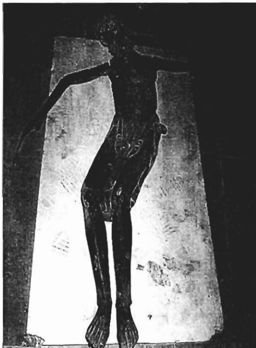
Cristo encontrado en San Pedro de Siresa, en julio de 1995.