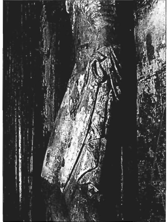
Cristo de la ermita de San Mamés. Asín de Broto (Boltaña). Detalle del paño de pureza.

preciada. En consecuencia, ordenó que hubiese perpetuamente en la iglesia de S. Pedro de Siresa trece Clérigos, los ocho para celebrar en ella los divinos Oficios, y los cinco para Vicarios de las iglesias de Etyo (Hecho), Escavos, Urdos, Biesa, y la casa de los Frayles, con dependencia del Vicario de San Pedro: los cuales debían concurrir a Siresa a celebrar la fiesta del Santo Apóstol en señal de subordinación y reverencia. Manda que todos los Racioneros coman en comunidad y duerman en el dormitorio; y que ni sanos ni enfermos se les suministre la ración fuera de casa: que no se les dé carne en los Sábados, si no fueren fiestas dobles, entre las cuales cuenta a Sta. Eulalia de Barcelona, por haberlo criado desde la infancia; donde se ve que la abstinencia del Sábado no era de rigurosa observancia en aquel tiempo. Finalmente ordena, que el obispo dispute uno de los Clérigos para limosnero, quien deberá tener seis camas a lo menos para los pobres y peregrinos. Para todo lo qual cedió la mitad de las décimas y labores que tenía desde la angostura llamada Foz en el valle de Etyo (Hecho), hasta la cumbre de los Pirineos, sin otras rentas en Embún y varios lugares 22 .