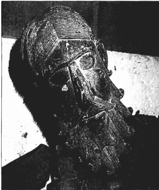
Cristo de Siresa. Detalle de la cara.