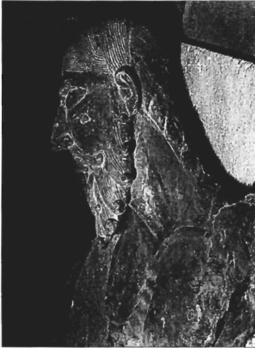
Cristo de Siresa. Detalle del lado izquierdo del rostro.