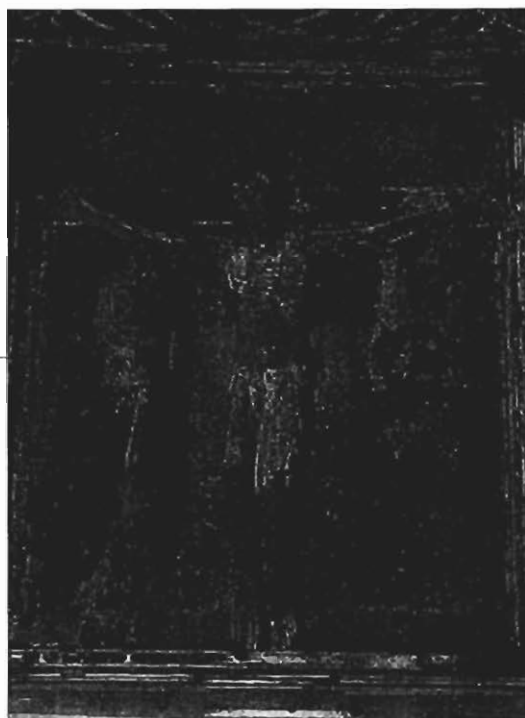
Cristo de la ermita de San Mamés. Asín de Broto (Boltaña).