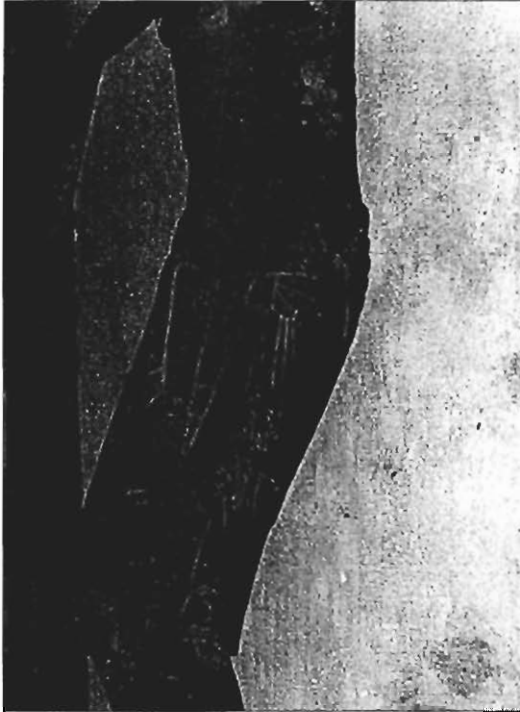
Cristo de Siresa. Detalle del paño de pureza.