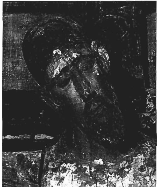
Cristo de la ermita de San Mamés. Así de Broto (Boltaña). Detalle de la cara.

Con este obispo se termina la época gloriosa para el monasterio: los sucesores de fray Ademar, salvo excepciones y en fechas muy posteriores a las aquí reseñadas, no desarrollarán labor de mecenazgo en relación con Siresa. Por esto, en nuestra opinión, la llegada a la iglesia del monasterio de Siresa del grupo del Descendimiento, del que la imagen del Cristo recientemente aparecida sería la figura principal, hay que fijarla en un periodo comprendido entre las disposiciones dictadas por el obispo Vidal de Canellas, en 1252, hasta el fallecimiento del obispo Domingo Sola, en 1269, fechas que, por lo demás, se ajustan perfectamente al estilo artístico de la obra.