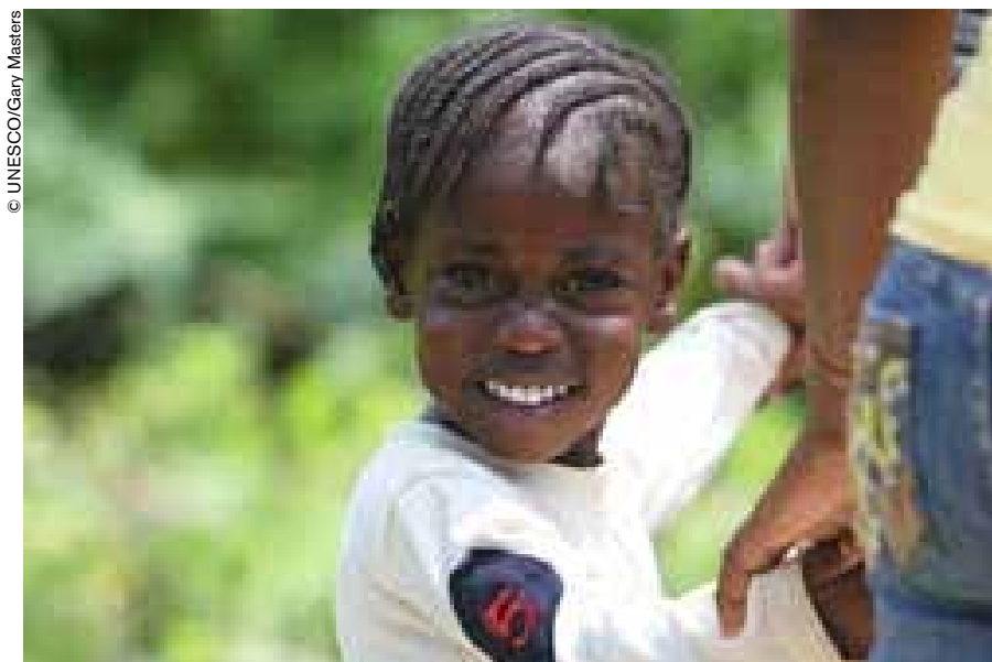
El Programa de Cuidadores Errantes de Jamaica (RCP) una iniciativa de desarrollo de la infancia centrada en las comunidades rurales.