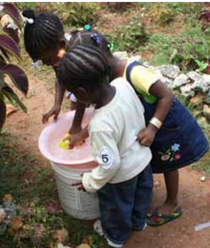
El programa jamaicano de educadores itinerantes brinda también nociones de higiene a los más pequeños.