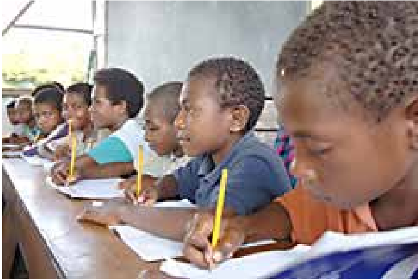
Escuela elemental de Sampubangin, Markham Valley.

a atención y educación de la primera infancia debería ser objeto a priori de una gran solicitud. En primer lugar, es el primero de los objetivos de la Educación para Todos fijados por la comunidad mundial el año 2000, en el Foro Mundial sobre la Educación de Dakar. Además, la Convención sobre los Derechos del Niño, ratificada por nada menos que 192 países, la reconoce como un derecho. Por último, es bien sabido que los primeros años de la vida de un niño son decisivos para su futuro y, en particular, para su éxito en la escuela. Muchos estudios lo demuestran.